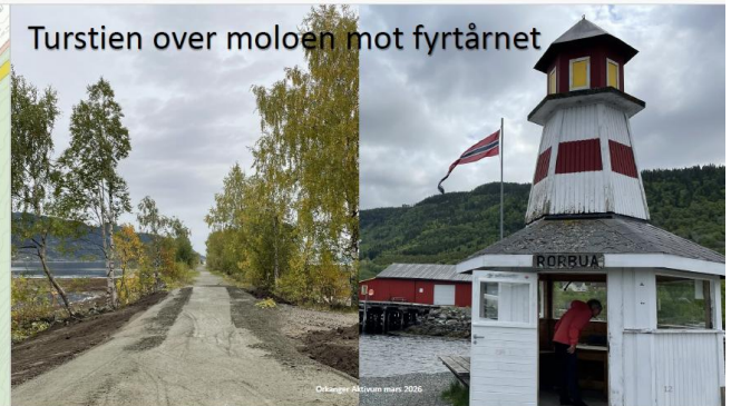
Turstien over moloen mot fyrtårnet