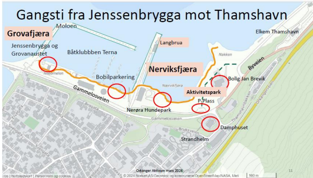
Gangsti fra Jossenbrygga mot Thamshavn