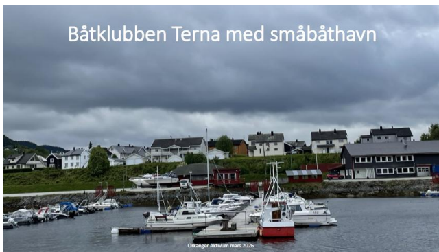
Båtklubben Terna med småbåthavn