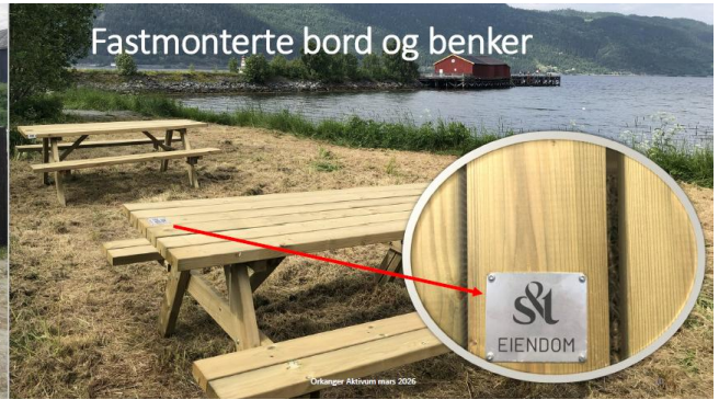
Fastmonterte bord og benker