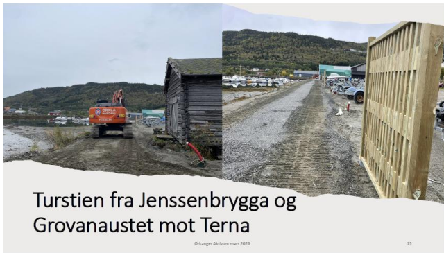
Turstien fra Jossenbrygga og Grovanaustet mot Terna