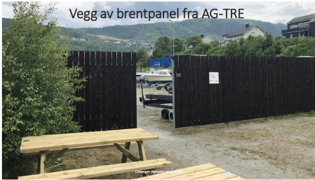
Vegg av brentpanel fra AG-TRE