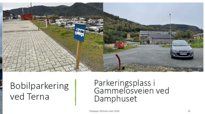
Bobilparkering ved Terna